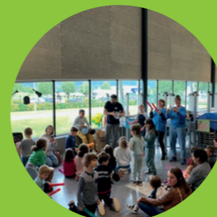
Alors on danse !!!