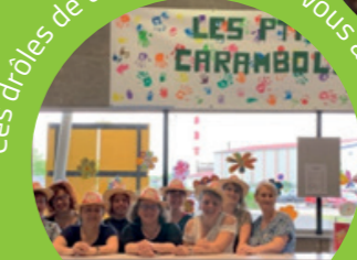
avec des crêpes !