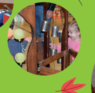
Chut ! On ouvre ses oreilles...