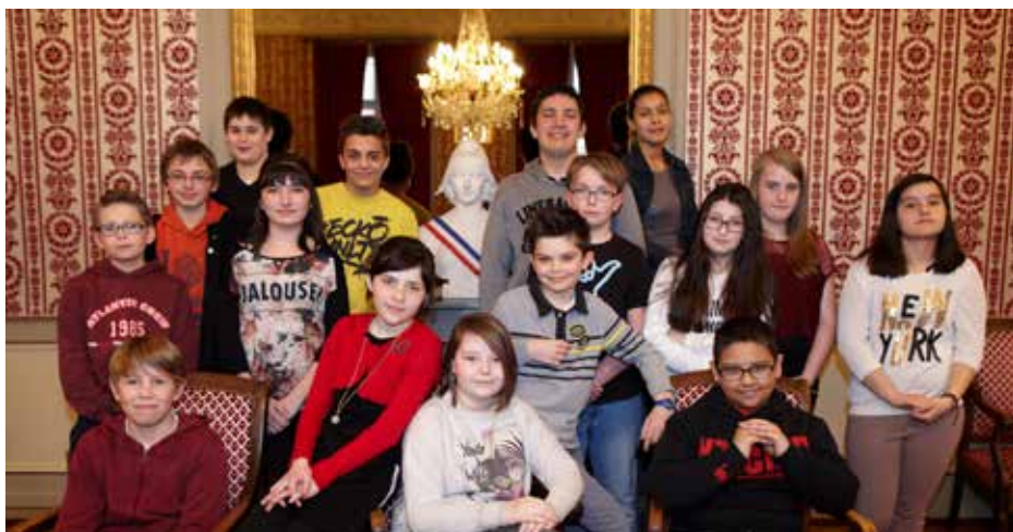
NDLR : photographie de groupe prise lors d'une séance en présence de 16 jeunes sur 25.

DÉMOCRATIE LOCALE Depuis fin 2014, 25 nouveaux représentants siègent au Conseil des Jeunes de Pontarlier. Pour ces jeunes, 2015 est une année qui allie prise de fonction et découverte de la vie municipale. Une année déjà riche en expériences, qui leur permettra d'engager dès 2016 leurs propres projets !