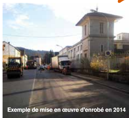
Exemple de mise en œuvre d'enrobé en 2014