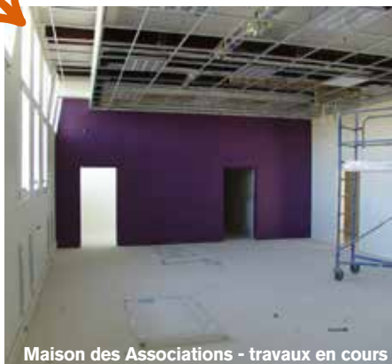
Maison des Associations - travaux en cours