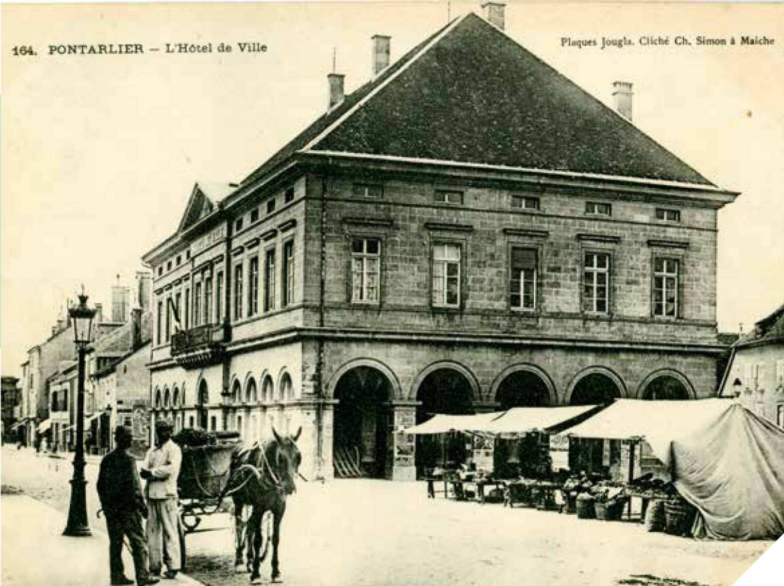
164. PONTARLIER – L'Hotel de Ville