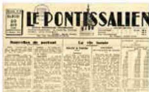
PRESSE LOCALE NUMÉRISÉE