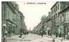
CARTES POSTALES ET PLANS