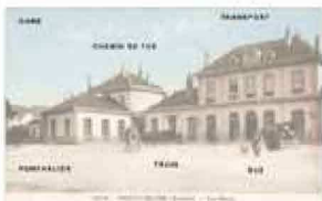
RECHERCHES SUR LES INDEX