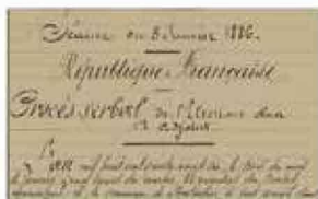
DÉLIBÉRATIONS DU CONSEIL MUNICIPAL

Depuis le site des Archives municipales de Pontarlier, dans la rubrique « Archives en ligne », accédez à de nombreux documents numérisés.