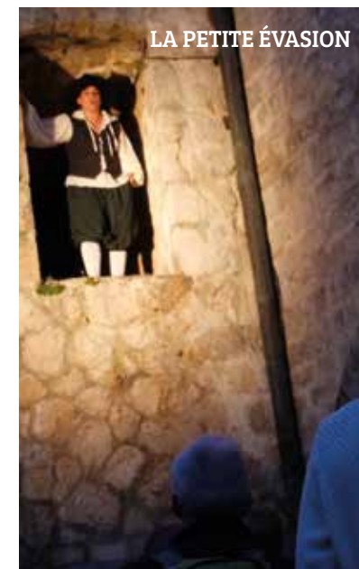
LA PETITE ÉVASION