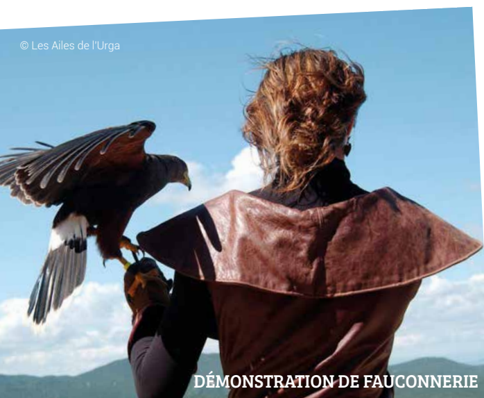
DÉMONSTRATION DE FAUCONNERIE

Mais au fait, ils deviennent quoi nos déchets ? Il paraît que 114 canettes de soda permettent de fabriquer 1 trotinette et que les ordures