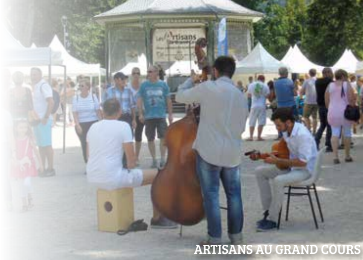
ARTISANS AU GRAND COURS