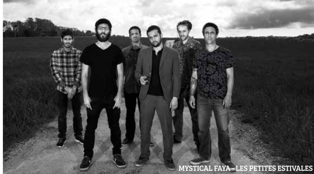
MYSTICAL FAYA - LES PETITES ESTIVALES

Détails, tarifs et renseignements voir vendredi 10